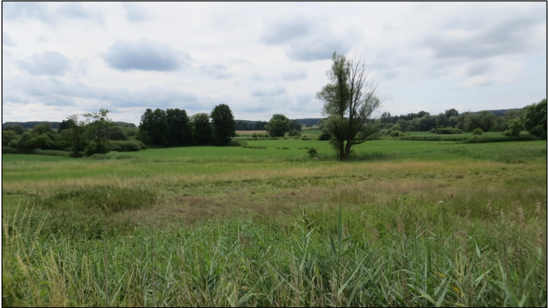
Abb. 2: Landschaftseindruck des Paartals vom Paarkanal nach Süden