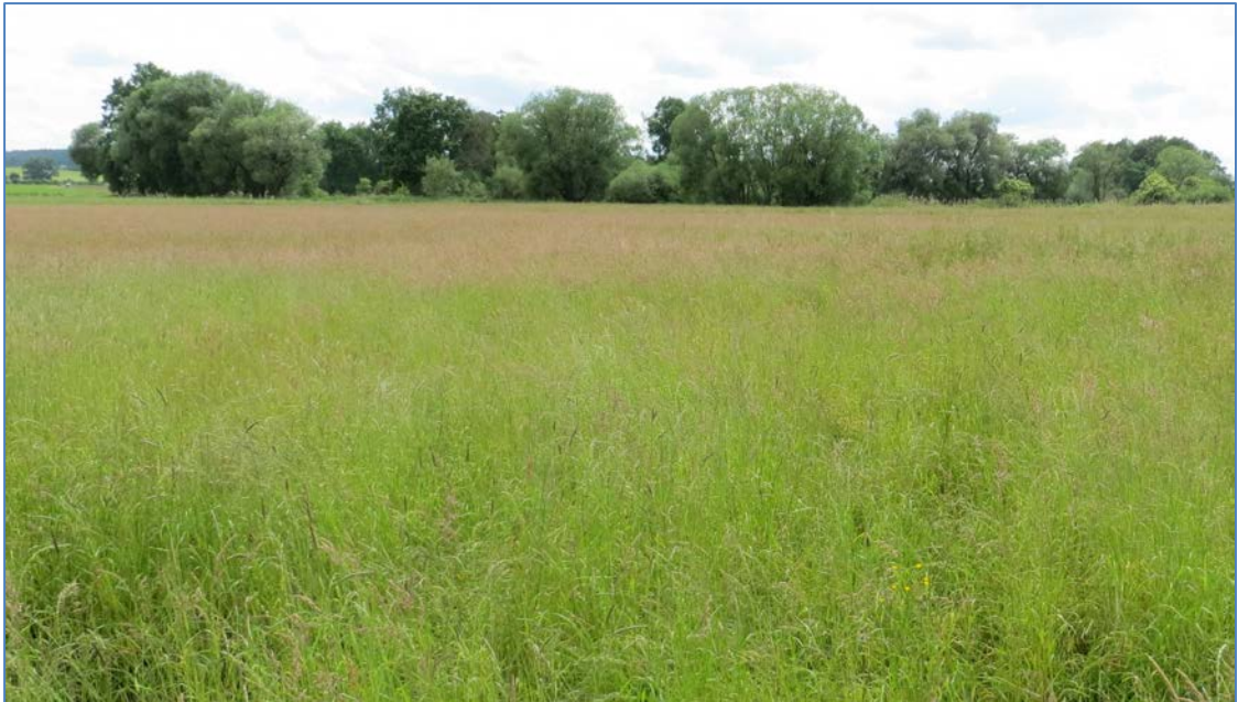
Abb. 7: Blick auf Galerieauwald an der Alten Paar (LRT 91E0*) von Osten aus

zusätzliche Wirkpfade von Eingriffen aufgrund des Vorkommens der genannten lebensraumtypischen bzw. charakteristischen Tierarten werden im Folgenden abgeprüft.