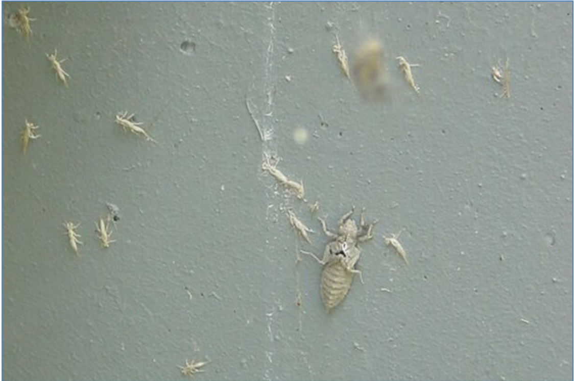
Abb. 8: Larvenhaut (Exuvie) der Grünen Keiljungfer an Brückenpfeiler (Paarkanal)

Der Paarkanal, der im Umfeld des Vorhabens als Entwicklungshabitat fungiert, weist eine relativ hohe Strömungsgeschwindigkeit auf; die Gewässersohle ist sandig. Vereinzelt treten Wasserpflanzenbestände auf. Der geradlinig angelegte Kanal wird von Staudenfluren, Weiden und Erlen begleitet, die ein relativ naturnahes Uferbild erzeugen. An einzelnen Stellen sind die Uferbefestigungen mit Stahlspundwänden oder Beton erkennbar. Ca. 200 m östlich der geplanten Trasse wird das Wasser des Paarkanals zu Energiegewinnung über eine Turbine geleitet, ebenso im Leinfelderwerk am Rand des Stadtgebiets Schrobenhausen.