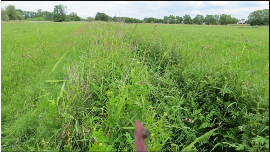
Abb. 4: Rettenbach mit Gewässervegetation aus Aufrechtem Merk (LRT 3260)