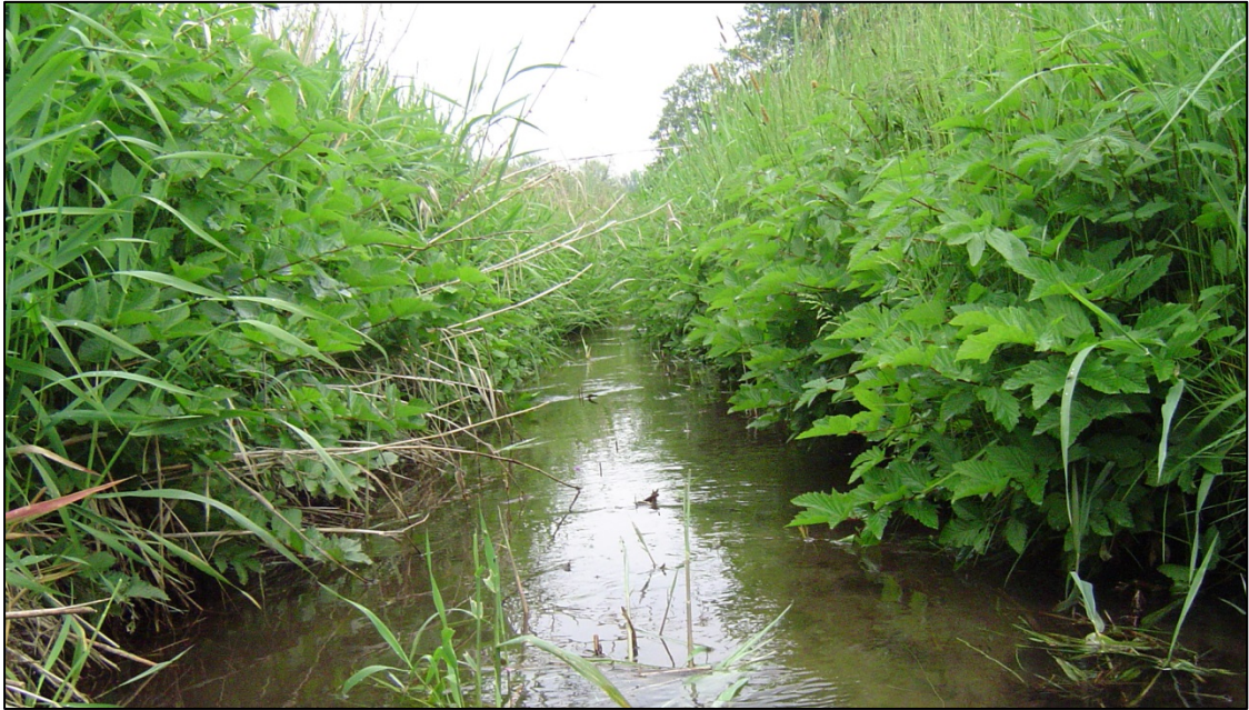
Abb. 5: Hochstaudensäume (LRT 6430) am Rettenbach