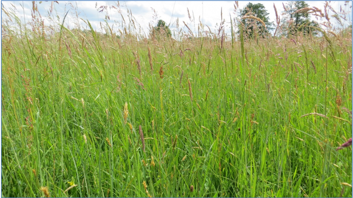
Abb. 6: Magere Flachland-Mähwiese (LRT 6510) nahe der Alten Paar

Ein Wiederherstellungserfordernis für den Lebensraumtyp insgesamt im FFH-Gebiet – wie es sich aus den Angaben im Standarddatenbogen und evtl. auch aus jenen im Entwurf des FFH-Managementplans ergeben könnte – kann in weiten Bereichen des Paartals bedient werden, da auf umfangreich nur leicht feucht getönten Standorten in der Aue wie auch zum Talrand hin häufig extensivierbare Grünlandflächen mit geeigneten Standortvoraussetzungen liegen. Auch im hier gegenständlichen Abschnitt käme die Anlage zusätzlicher LRT-Flächen vielfach in Frage. Wie auch der Entwurf von Maßnahmen im FFH-Managementplan zeigt (vgl. Kap. 2.5), handelt es sich beim Wirkungsbereich des Vorhabens nicht um einen obligatorischen Bereich hinsichtlich der Wiederherstellung des LRT. Die Herstellung zusätzlicher LRT-Flächen im Gebiet ist jedoch selbstverständlich als Maßnahme wünschenswert.