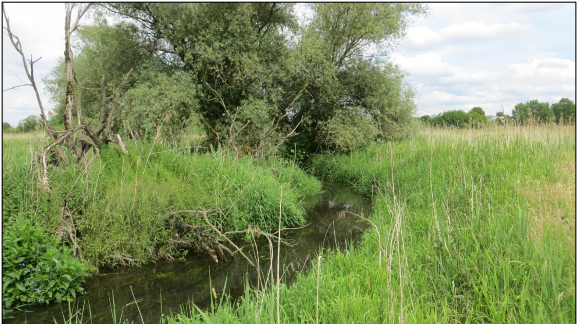
Abb. 3: Alte Paar mit Gewässervegetation (LRT 3260)

Aufgrund der massiven Veränderung des Abflussverhaltens und der entsprechenden Reduktion der Strömungsdynamik wie auch aufgrund der artenarmen Ausstattung der Gewässervegetation wird der Erhaltungszustand trotz des naturnah mäandrierend erhaltenen Verlaufs, in Übereinstimmung mit dem Vorabauszug aus dem FFH-Managementplan, mit „C“ (mittel bis schlecht) eingestuft. Für den insgesamt mit „B“ (gut) bewerteten Erhaltungszustand des LRT im FFH-Gebiet ist eine Wiederherstellung dieser Teilfläche nicht erforderlich. Als Voraussetzung für die Wiederherstellung eines guten Erhaltungszustandes für diesen Gewässerabschnitt ist eindeutig die Wiedereinleitung von Paarwasser, möglichst verbunden mit Herstellung der fischbiologischen Durchgängigkeit und Verbesserungen der Gewässerqualität, zu betrachten. Aufgrund des naturnah erhaltenen Verlaufs mit noch guter Ausprägung der Habitatstrukturen kann durch Reduzierung der Beeinträchtigungen auf ein mittleres Maß unabhängig von der Artausstattung ein guter Erhaltungszustand erreicht werden.